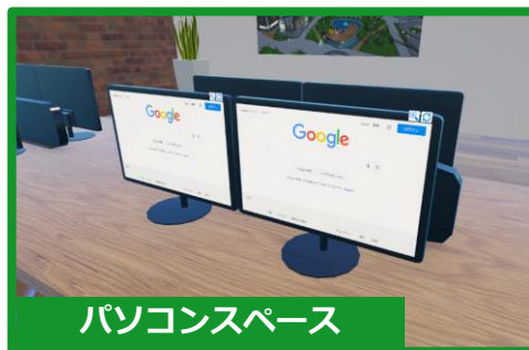
パソコンスペース