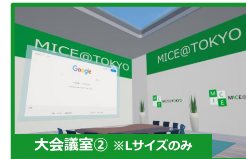
大会議室② ※Lサイズのみ