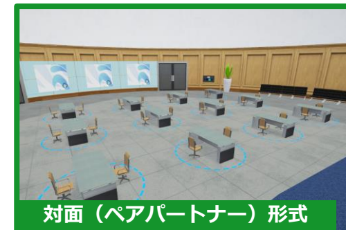
対面（ペアパートナー）形式