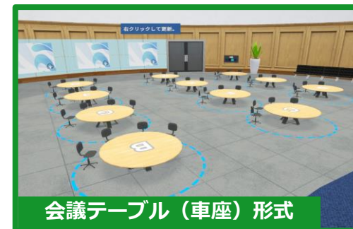
会議テーブル（車座）形式