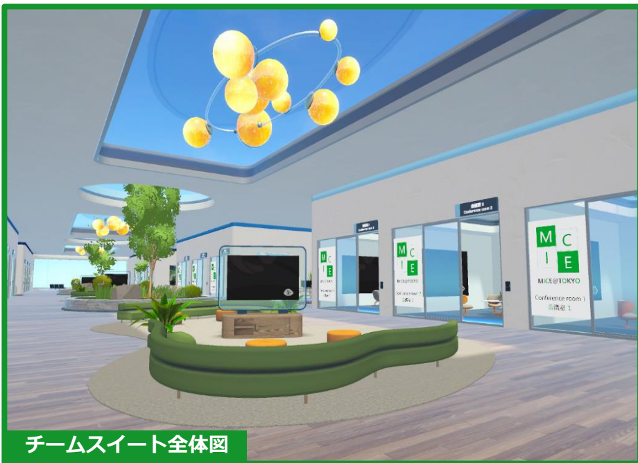
チームスイート全体図

複数の会議室や様々な用途に利用可能なスペースで構成された施設です。会期中のオフィス利用のほか、商談や意見交換会など、双方向のコミュニケーションに適した空間です。