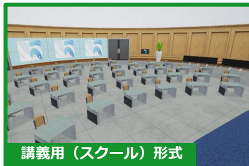
講義用（スクール）形式