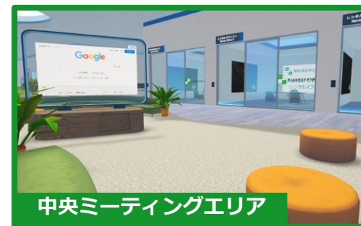
中央ミーティングエリア