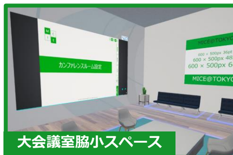
大会議室脇小スペース