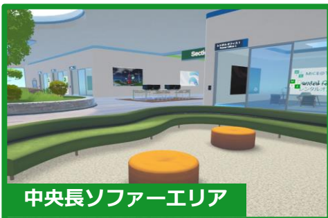
中央長ソファーエリア